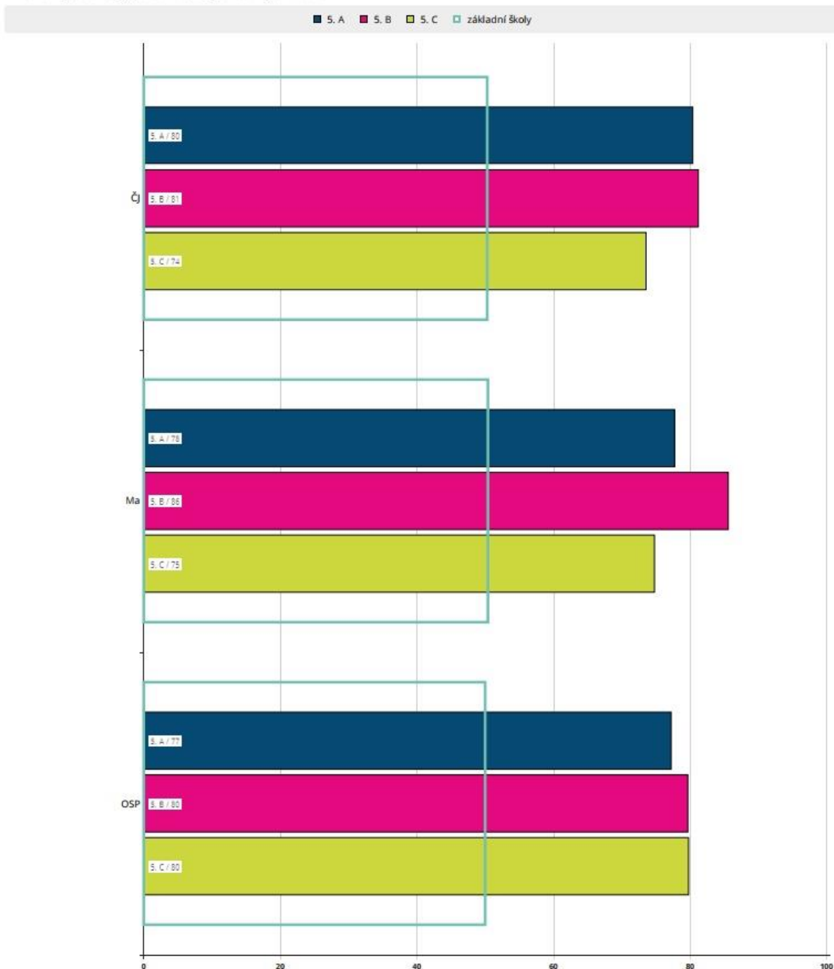
Průměrný celkový percentil po jednotlivých třídách

gymnázií. Jako vždy se psal test z Čj, M, OSP a Aj. Pokud budeme porovnávat jednotlivé třídy, nejlepší výsledky měla 5. A. Pouze v anglickém jazyce předstihla 5. A třída 5. C. Výsledky 5. A byly ve všech předmětech dokonce lepší než výsledky víceletých gymnázií.